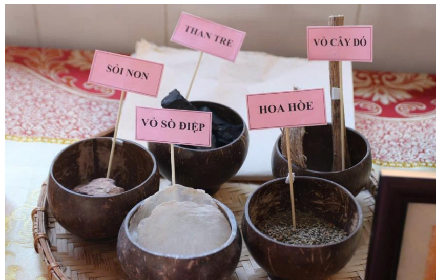
Nguyên liệu tạo màu tranh Đông Hồ