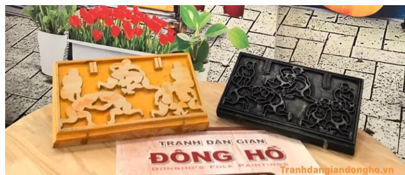
Bản khắc gỗ dùng để in tranh Đông Hồ