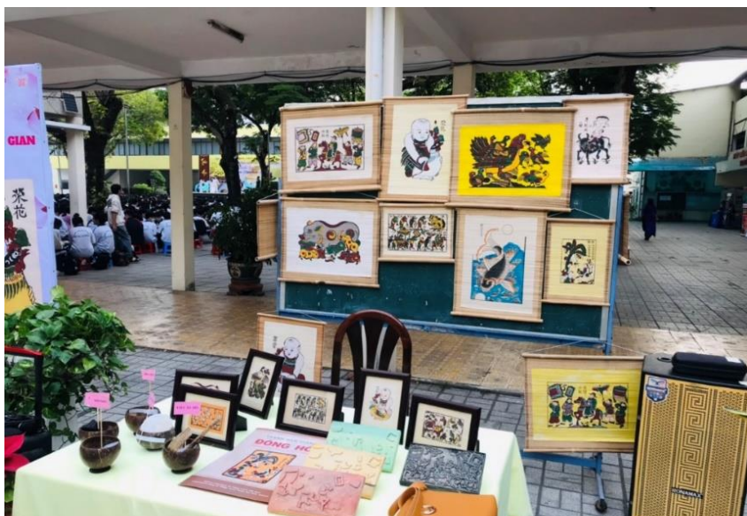
Góc trưng bày trải nghiệm làm tranh Đông Hồ